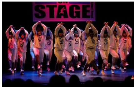
Steep am Juniors on Stage