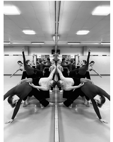
Sphere im Training