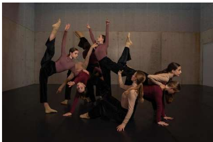
Videodreh mit Sphere