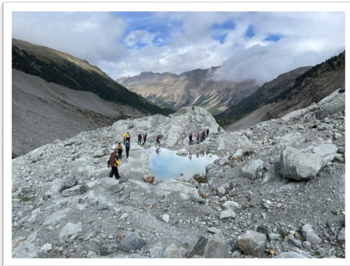
Gletschertour in Pontresina